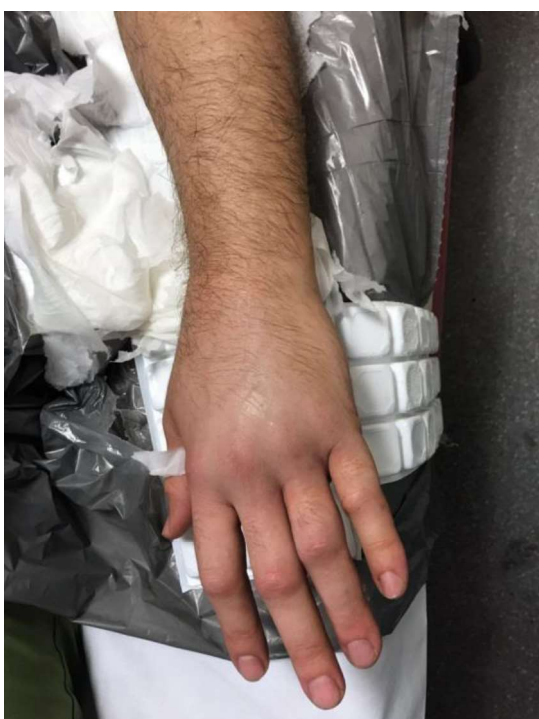
Figura 2. Extremidad superior izquierda, 2 horas después del accidente (detalle).