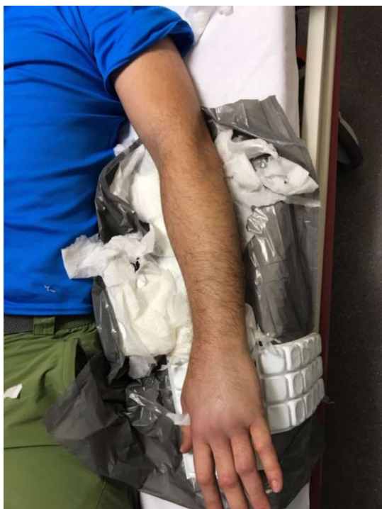
Figura 2. Extremidad superior izquierda, 2 horas después del accidente (detalle).